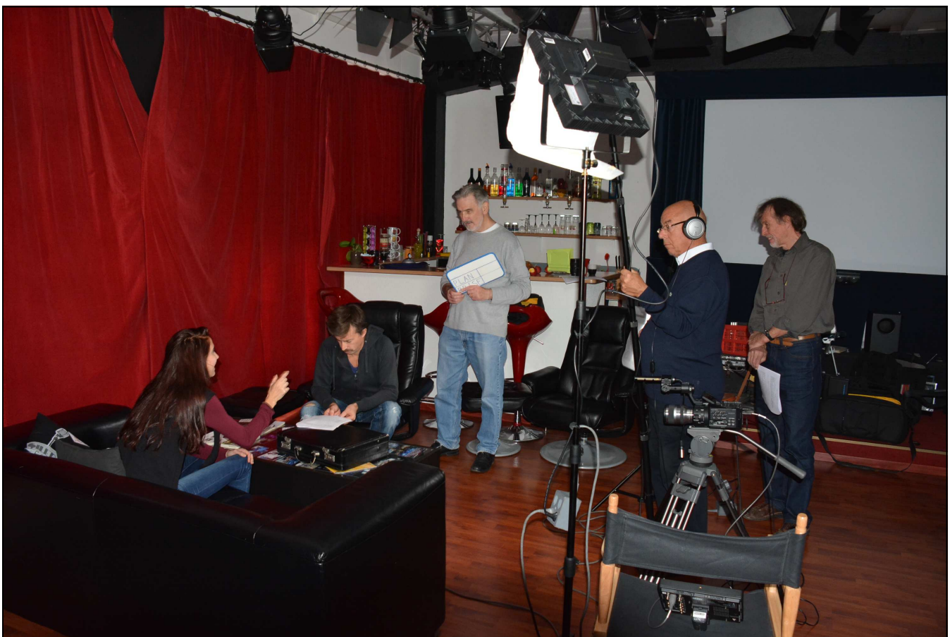
Casting - Comédiens et techniciens concentrés