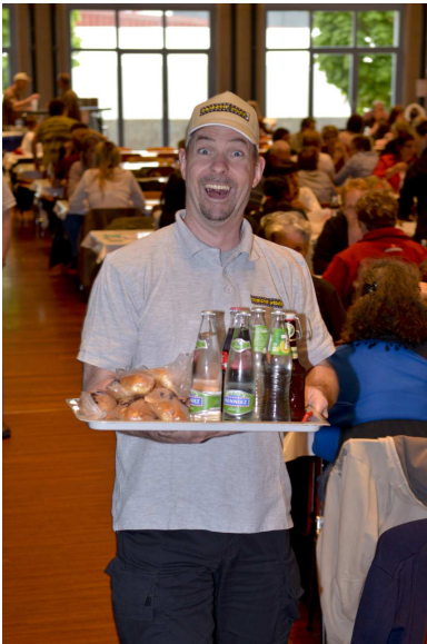
Joie et bonne humeur!