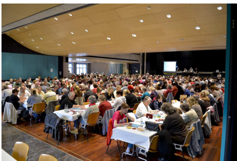
Quel succès. La salle était comble.

Le jour férié qui précédait ce samedi 11 mai, nous rendait sceptiques. Eh bien nous avons torts! Ce Loto fut un véritable succès. La salle de la Marive était comble. Pas loin de 500 personnes. Tous les bénévoles ont travaillé avec enthousiasme. La vente des consommations s'est déroulée de manière efficace.