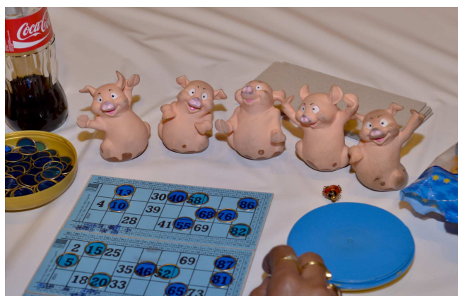
Loto 2013: Ces petits cochons ont-il porté chance?