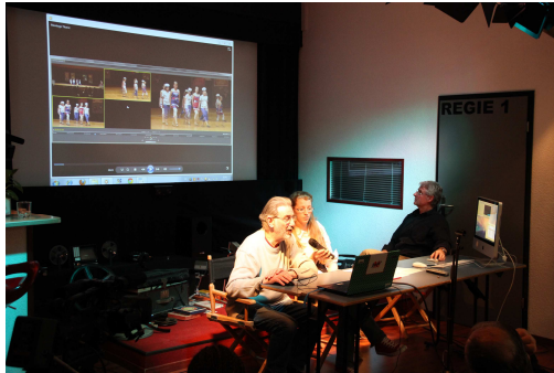
Le trio en pleine démonstration

Chacun notera que la réalisation en "live" sur Internet et son enregistrement visible sur notre site a aussi utilisé 3 caméras.