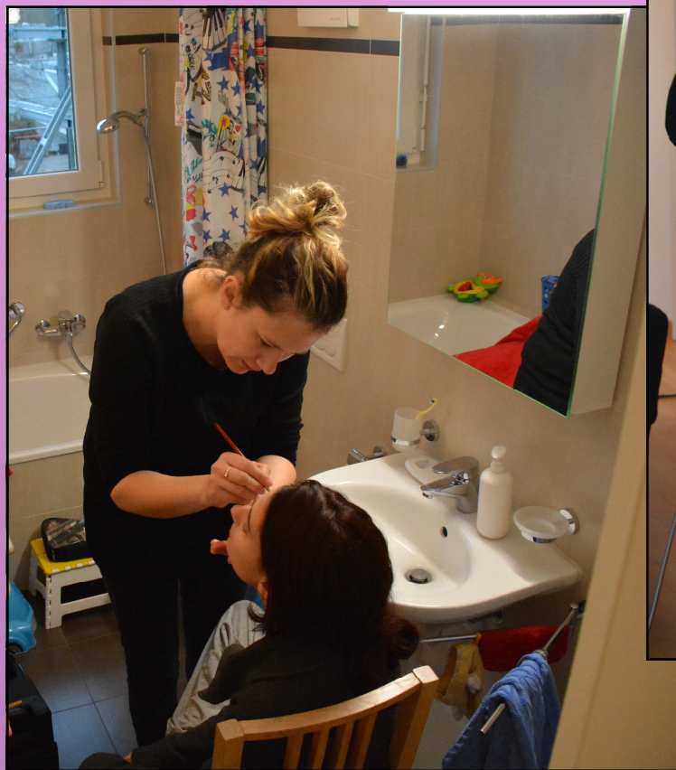
Tournage du thriller « Ombre » - arrivée sur le lieu de tournage, briefing, maquillage, réglage de la NEX-FS100