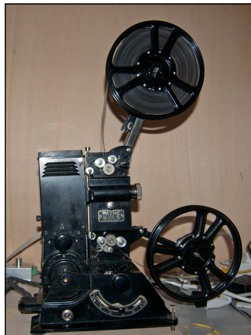
Projecteur Pathé Type H Photo FA

L'avènement de la pellicule ininflammable, dite de sécurité, permet le vrais démarrage du cinéma d'amateur.