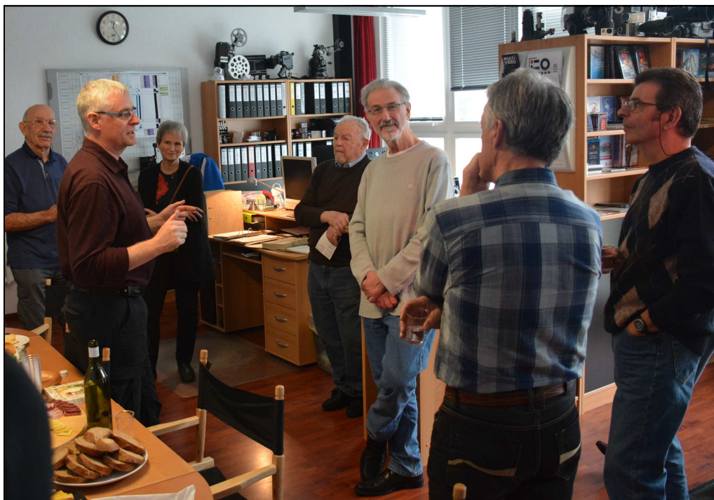
Membres anciens et actuels racontent...

1) Nom d'une ligne de chemin de fer touristique au dessus de Vevey