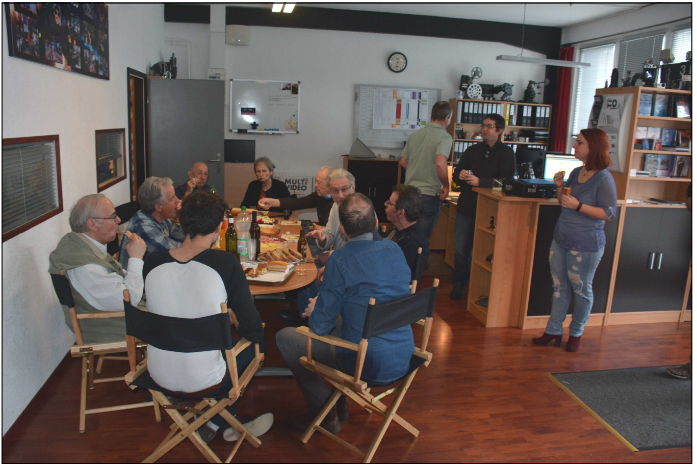
Fête du 40 ème