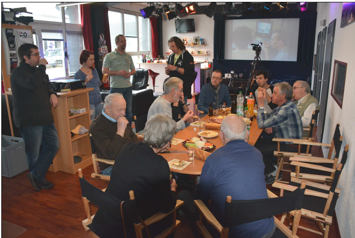
Fête du 40 ème

Montés et sonorisés, ces 13 films ont constitué un magnifique documentaire, témoin d'un travail d'équipe bien coordonné. Il a ravi