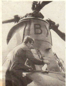
Toilette matinale pour le monstrueux hélicoptère «Chinook». Alain Martin-a

Le Club de cinéastes amateurs yverdonnois Objectif Super Huit organisera une projection publique le vendredi 4 avril. Cette séance aura lieu à 20 heures au Foyer du Casino, au 1er étage. L'entrée est libre. Deux films sur le thème de l'aviation seront présentés à cette occasion.