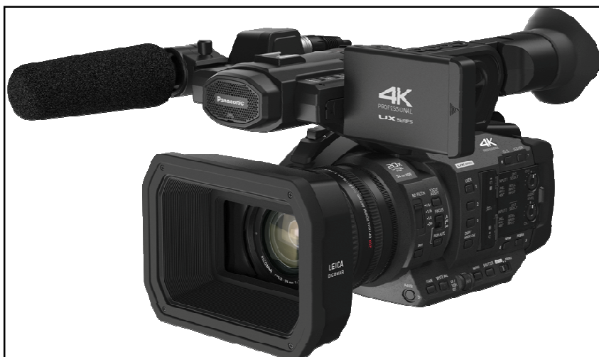
Panasonic AG UX-180

Et c'est parti pour les premiers essais. Ce « Gimbal 1 » permet une prise à 2 mains, ce qui, vu le poids du tout, n'est pas un luxe. Plusieurs modes de fonctionnement sont offerts : le mode L ( lock ) maintient la caméra fixe dans les 3 axes. A l'autre extrême, en mode POV ( Point of View ), la caméra suit tous les mouvements mais avec une excellente fluidité. Le mode le plus utilisé sera vraisemblablement PF ( Pan Follow ) qui bloque les axes d'inclinaison et de roulis et qui permet de faire des panoramiques fluides (par exemple tourner autour