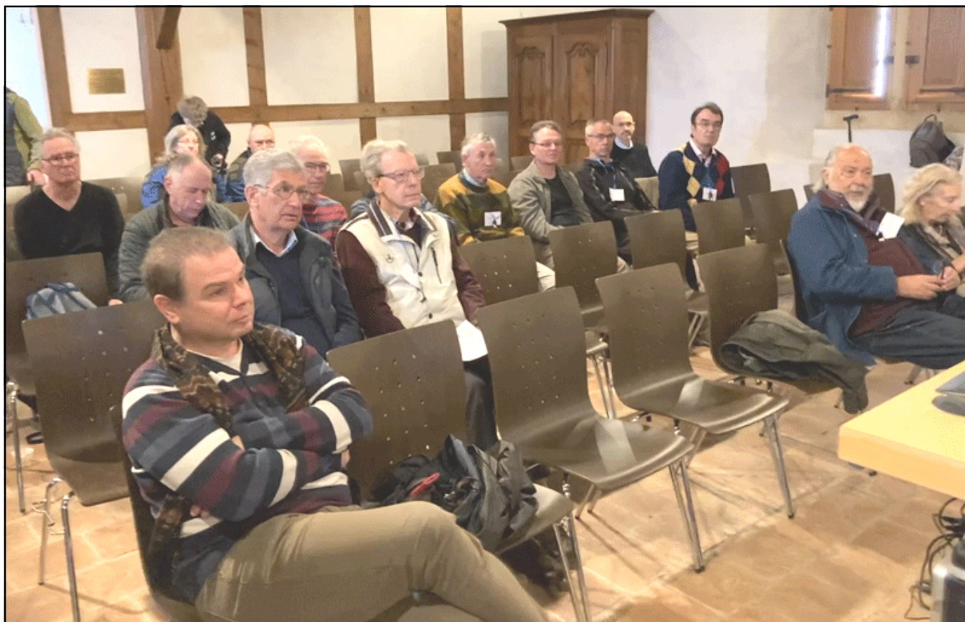
Public très attentif