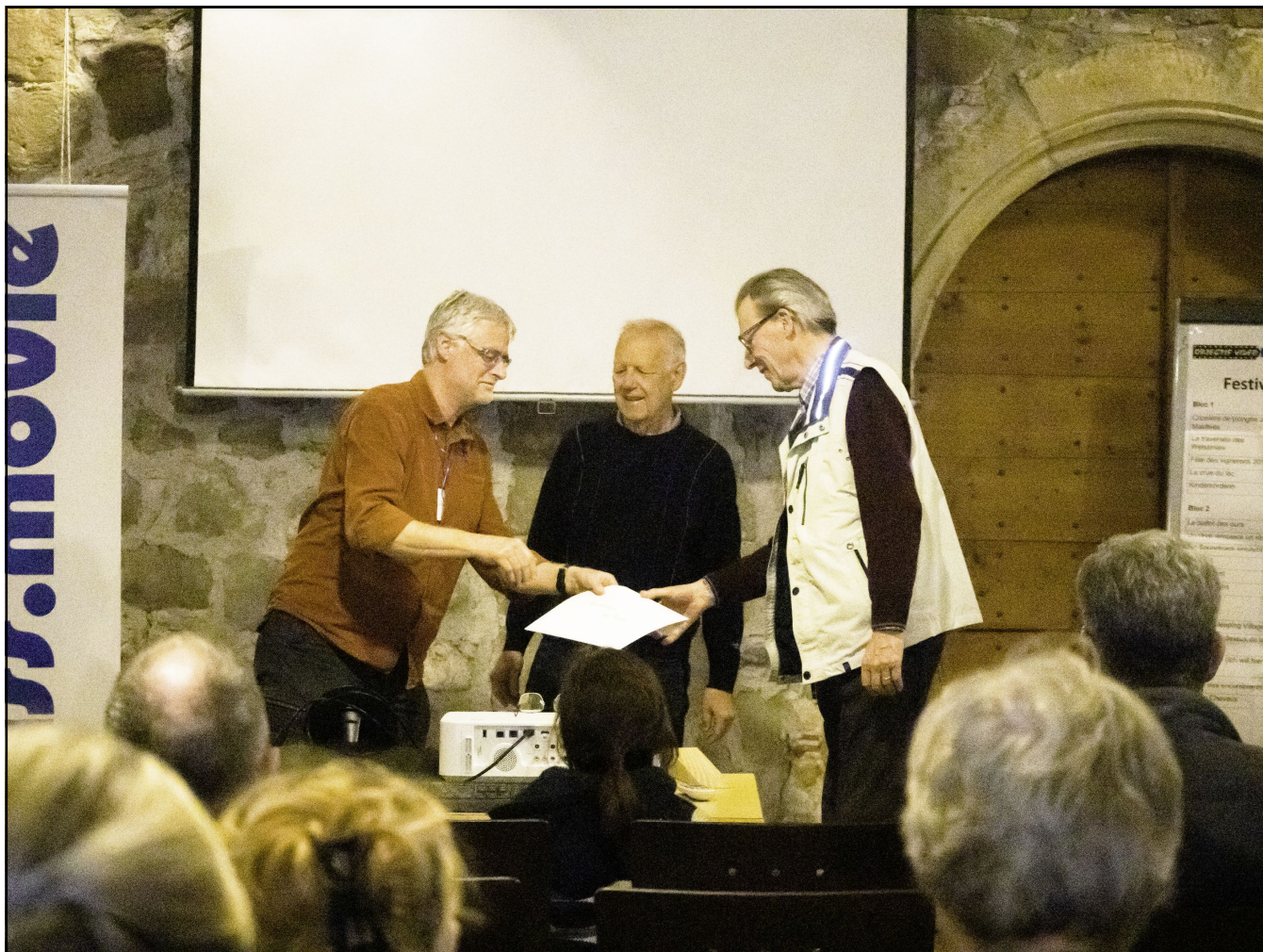
Distribution de prix