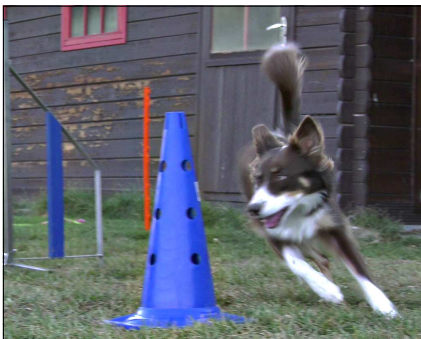
Une vedette du clip pour Cabot'in

moindres fut le FRMCY 1 , acronyme imprononçable qui n'a cependant pas rebuté les candidats à la projection de leur film.