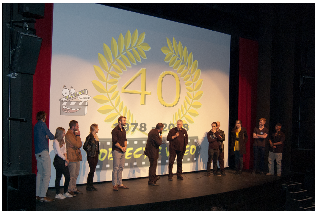
Festival Romand du Court Métrage d'Yverdon

Un des événements et non des moindres fut le FRMCY, acronyme imprononçable qui n'a cependant pas retenu les candidats à la projection de leur film.