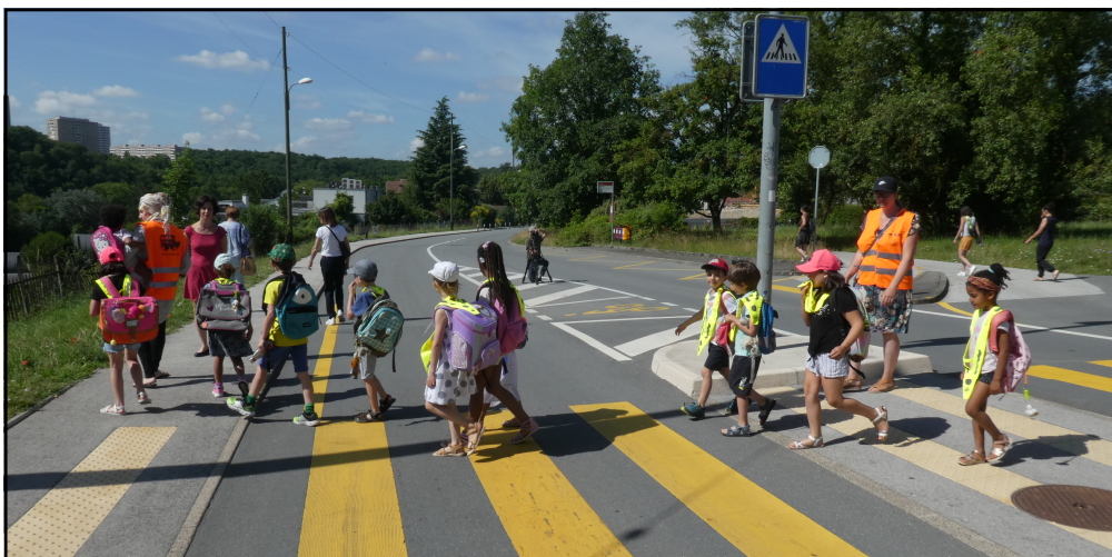
Le Pedibus Genève

Pas tout simple d'illustrer une chanson : il faut trouver un juste équilibre entre des plans avec la chanteuse et des plans avec les enfants. Les bases ont été fixées lors d'une première séance, le