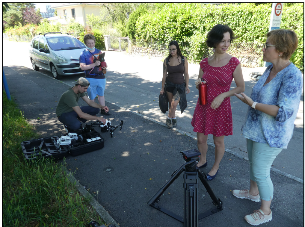
Préparation du tournage du clip Pédibus Genève