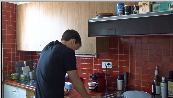
CONSÉQUENCE De Lynn Bonvin